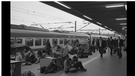
Fig. 2. Film still tratto dal video essay «Algorithmic Borders», Silvia Cipelletti, 2025.

Per facilitare la risoluzione di questo secondo paradosso scalare si è dunque deciso di intraprendere un primo capitolo della tesi che analizzasse attraverso il video essay un paesaggio di confine di scala globale e di impatto planetario, il Mediterraneo.