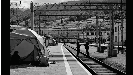
Fig. 1. Film still tratto dal video essay Algorithmic Borders , Silvia Cipelletti, 2025

confine e lo sviluppo di una conoscenza e un immaginario condiviso di questi territori.